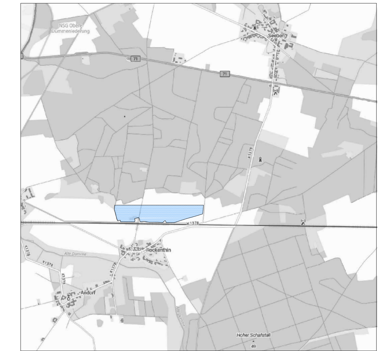
Kartengrundlage: Darstellung auf der Grundlage der Topographischen Karte 1:10.000...

Einsehbarkeit Rechtsgrundlagen: Örtliche Bauvorschriften, Abstände zu Nachbargrundstücken, etc.